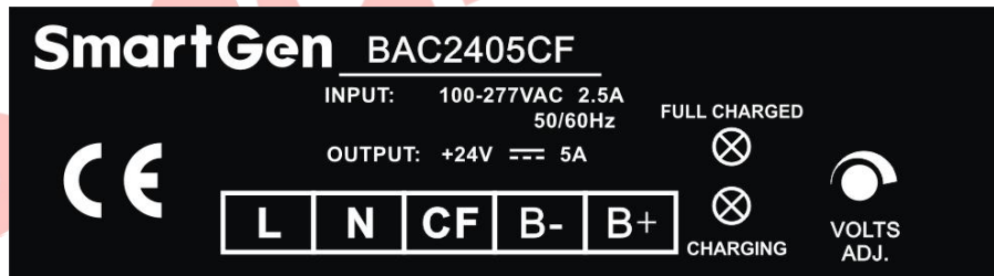
图2 BAC2405CF 面膜图